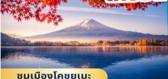
ชมเมืองโคชูยูเมะ