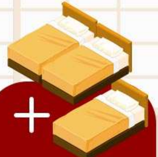
ห้องพัก 1 ห้องสำหรับ 3 คน (TRIPLE BED ROOM)

*กรณีที่บางโรงแรมไม่มีห้องประเภทนี้ ทางโคดิจะเปลี่ยนเป็นห้อง TWN แทน