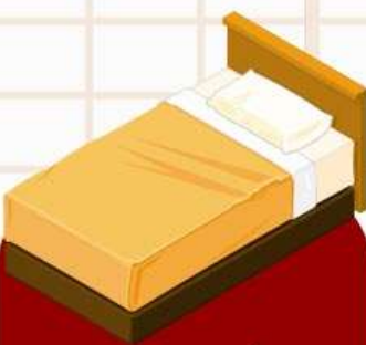
ห้องพักเตียงเดี่ยว (SINGLE BED ROOM)

ห้องพักสำหรับนอนท่านเดียว แต่มีค่าใช้จ่ายเพิ่มเติม จากค่าทัวร์