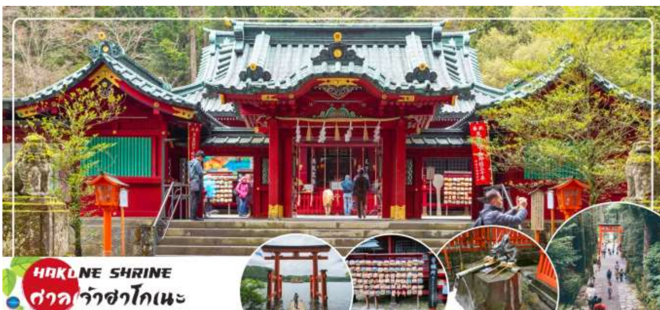
HAKONE SHRINE ศาลเจ้าฮาโกเนะ

จากนั้นนำท่าน ชมวิวทะเลสาบ 5 ศาลเจ้าฮาโกเนะ (Hakone Shrines) (ใช้เวลาเดินทางประมาณ 30 นาที) ศาลเจ้าเก่าแก่ในศาสนาชินโต ตั้งอยู่บริเวณตีนเขาฮาโกเนะ และอยู่ริมทะเลสาบอะชิ จังหวัดคานากาวา ประเทศญี่ปุ่น ไฮไลท์!!! เสาวโทธิสีแดง ริมทะเลสาบที่เป็นจุดถ่ายรูปยอดนิยม อีสระให้ท่านขอพรและถ่ายรูปตามอัธยาศัย