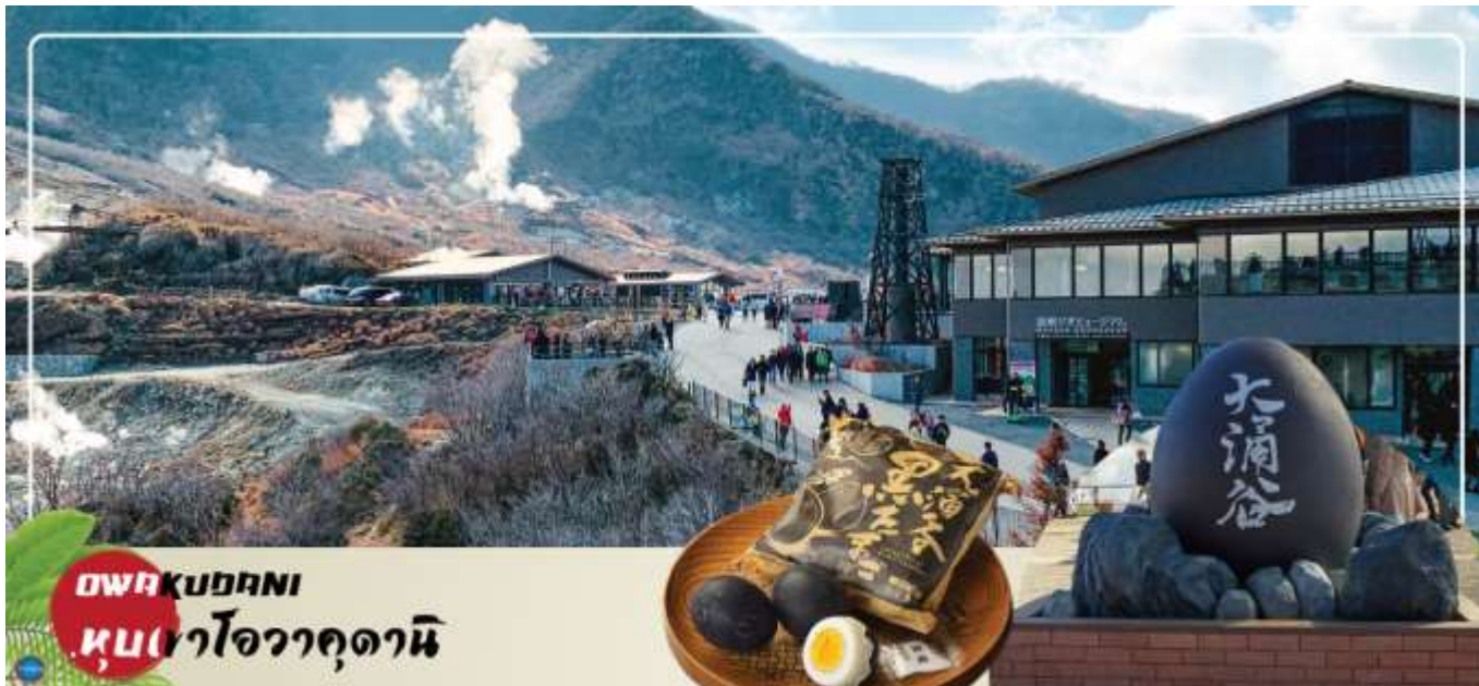
HAKONE DANI หุบเขาโอวาคุดานิ

จากนั้นนำท่าน ชมวิวทะเลสาบ 5 ศาลเจ้าฮาโกเนะ (Hakone Shrines) (ใช้เวลาเดินทางประมาณ 30 นาที) ศาลเจ้าเก่าแก่ในศาสนาชินโต ตั้งอยู่บริเวณตีนเขาฮาโกเนะ และอยู่ริมทะเลสาบอะชิ จังหวัดคานากาวา ประเทศญี่ปุ่น ไฮไลท์!!! เสาวโทธิสีแดง ริมทะเลสาบที่เป็นจุดถ่ายรูปยอดนิยม อีสระให้ท่านขอพรและถ่ายรูปตามอัธยาศัย