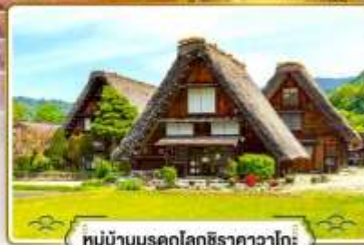
หมู่บ้านมรดกโลกชิราคาวาโกะ

✔ ช้อปบิงย่านฮิตที่สุดในโอซาก้า "ชินโซบาชิ"