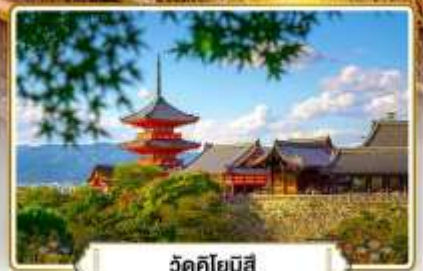
วัดคิโยมิตสึ