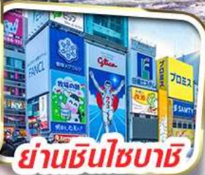
ย่านชินโซบาชิ