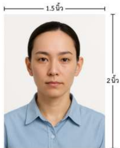
ขนาดรูปตัวอย่างใช้ยื่น Visa

*** ห้ามขีดเขียน แม็ก หรือใช้คลิปลวดหนีกระดาษ ซึ่งอาจส่งผลให้รูปถ่ายชำรุด และไม่สามารถใช้งานได้ ***