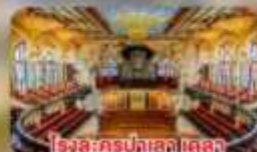
โรงละครปลาลา เดลา บูลีก้า คาตาลาบา