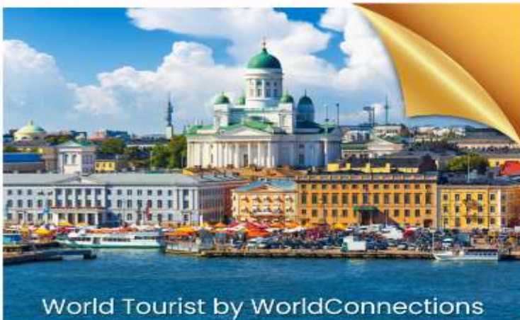
World Tourist by WorldConnections