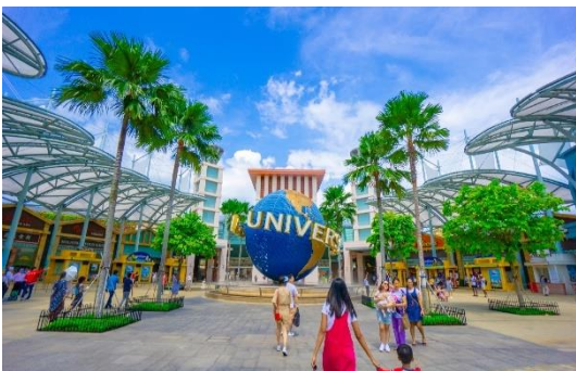
ราคา 1,090 บาท)

นำท่านสนุกสนานกับ UNIVERSAL STUDIO (รวมค่าบัตร) ให้ท่านได้พบกับการแสดงสุดตระการตาและความสุข สนุกไม่รู้จบ ในที่เดียวที่ๆ คุณและครอบครัวจะได้พบและสัมผัสกับประสบการณ์ใหม่ ที่โลกยังต้องตะลึง เปิดฉากความสนุกกับยูนิเวอร์แซลสตูดิโอ!! ที่แรกและที่เดียวในภูมิภาคเอเชียตะวันออกเฉียงใต้ กับเครื่องเล่น 24 ชนิดโดย 18ชนิด เป็นเครื่องเล่นที่ออกแบบใหม่หรือดัดแปลงเพื่อที่นี่โดยเฉพาะ