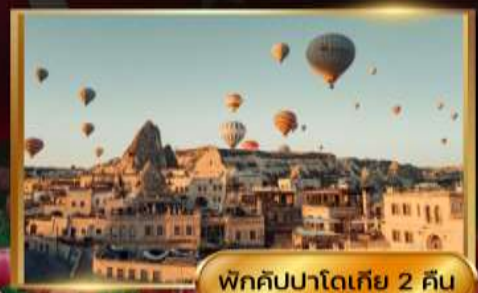
พิกคิปปาโดเกีย 2 คืน

*ราคาเริ่มต้นไป-กลับ ต่อ 1 ท่านเงื่อนไขเป็นไปตามที่กำหนด