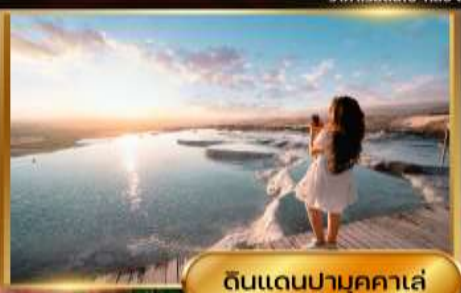
ดินแดนปามุคคาเล่