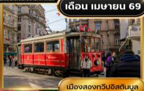
เมืองสองทวีปอิสตันบูล