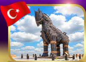
ม้าไม้เมืองทรอย ซานัคคาลั