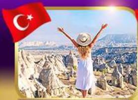
ชมความงาม หุบเขาแห่งรัก