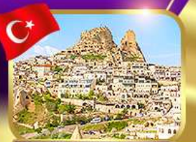
หุบเขาอุชิซาร์ คัปปาโดเกีย