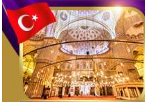
เข้าชมความงามสุเหร่าสีน้ำเงิน