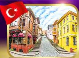
ชมบ้านหลากสีย่านบาลัก