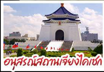
อนุสรณ์สถานเจียงไคเชก