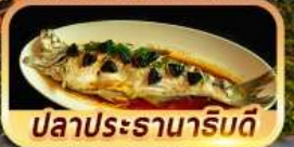
ปลาประรานาภิรมดี