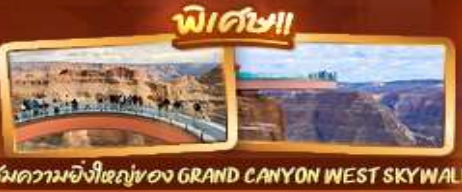
ชมความยิ่งใหญ่ของ GRAND CANYON WEST SKYWALK

📅 เดินทาง 6-14 มี.ค.69 / 20-28 มี.ค.69 3-11 เม.ย.69 / 10-18 เม.ย.69 1-9 พ.ค.69 / 29 พ.ค. - 6 มิ.ย.69