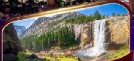
อุทยานแห่งชาติโยเซมิตี