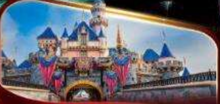
ดิสนีย์แลนด์ปาร์ค