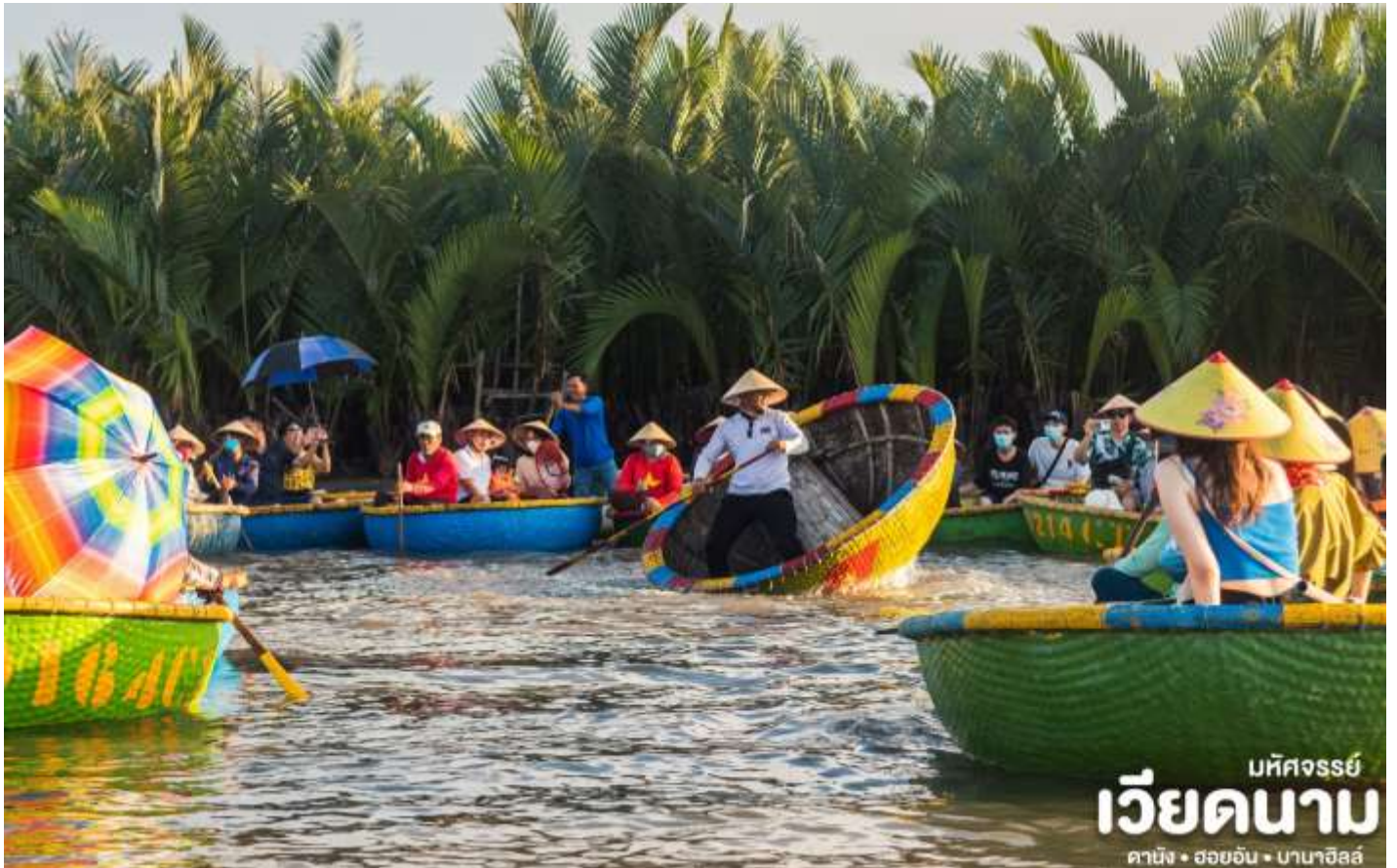
บทวิจารณ์ เวียดนาม ดาบิง • ฮอยอัน • บานาฮิลล์