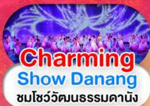
Charming Show Danang ชมโชว์วัฒนธรรมดานัง