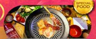
พิเศษเมนู BBQ Buffet เดินทาง มี.ค. - ต.ค. 69