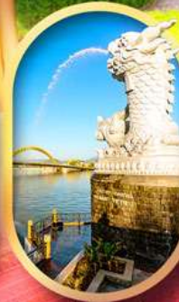
คาร์พดราท้อน