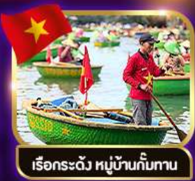
เรือกระด้ง หมู่บ้านก๊อบกาน