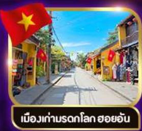
เมืองเก่ามรดกโลก ฮอยอัน