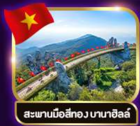
สะพานมือสีทอง บานาฮิลล์

เวียดนาม ดานัง ฮอยอัน พักบานาฮิลล์ 4วัน3คืน เดินทาง 1เม.ย. - 3เม.ย. 69