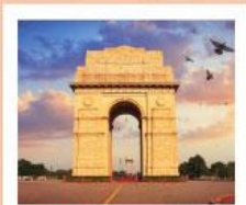
♥♦♦ India Gate