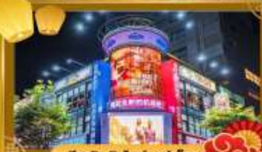
ช้อปปิ้งในทาคารีเก็ด