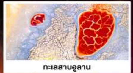
ทะเลสาบอูแลกัน