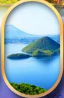
อิวทะเลสาบโทยะ