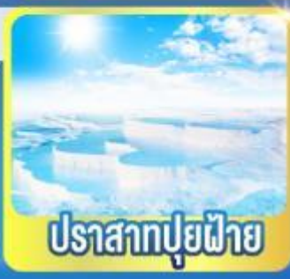
ปราสาทฟูยฟ้า