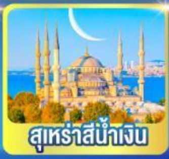
สุหรัสีน้ำเงิน