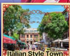
Italian Style Town