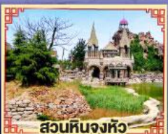
สวนหินงิ้วหวู่