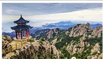
ภูเขาเลาซาน