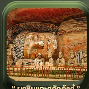
“ พาหินแกะสลักต้าจู๋ ”

T2G-CKG26CZ Special of Chongqing...วงชิง ต้าจู๋ อู่หลง อุทยานหลุมฟ้า เขานางฟ้า 5D 3N (CZ)