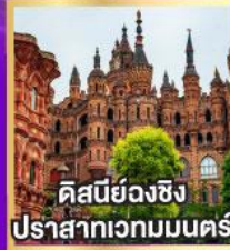
คิสบียังฉิง ปราสาทเวทมนตร์