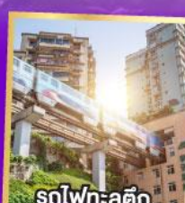
รถไฟฟ้า: ลูตึก