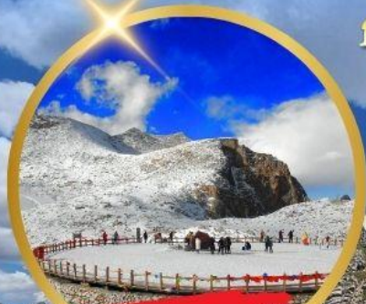
OPTIONAL TOUR ธารน้ำแข็งต๋ากู่ปิงชวน

NO SHOPPING ไม่เข้าร้าน ช้อปปิ้ง เที่ยวเต็มสุข