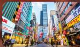
ซูปป์ิงชินจูกุ