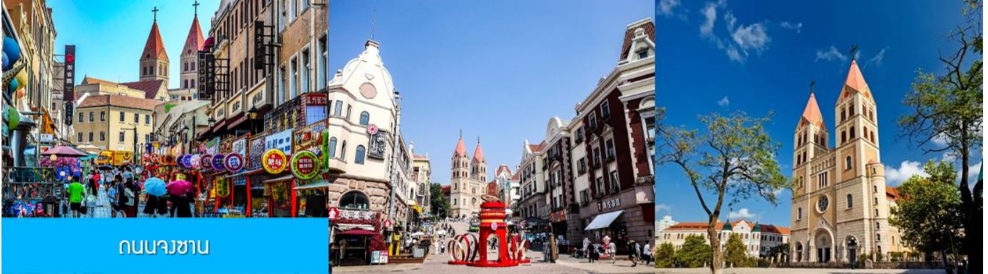
ถนนวซขาน

หลังอาหารนำท่านเดินทางชม สะพานจ้านเจียว 栈桥 เป็นแลนด์มาร์กแห่งประวัติศาสตร์คู่เมืองชิงเต่า สร้างเมื่อปี ค.ศ.1891 มีลักษณะเป็นสะพานหินทอดยาวกว่า 440 เมตรสู่ทะเล ปลายสะพานมีศาลา ทรงแปดเหลี่ยมสีแดงที่โดดเด่น ซึ่งเป็นสัญลักษณ์บนฉลากเบียร์ชิงเต่า ขึ้นชื่อเรื่องวิวสวย รับลมทะเล ให้ท่านเก็บภาพบรรยากาศ