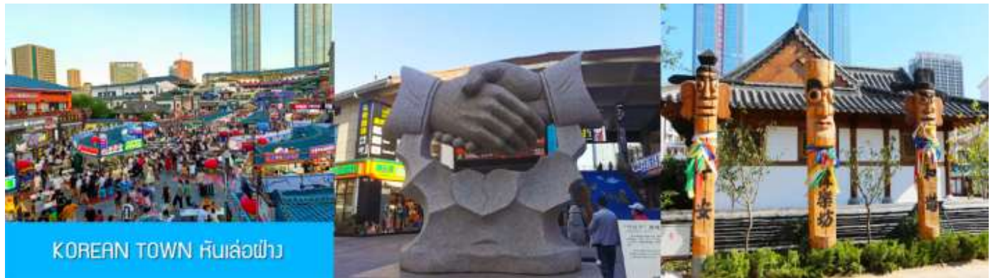
KOREAN TOWN หันเล่อฝ่าง