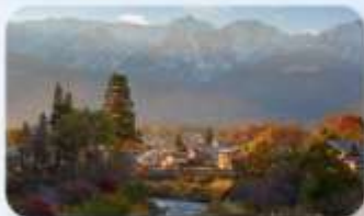
โออิเตะ ปาร์ค