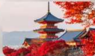
วัดคิโยมิชิ