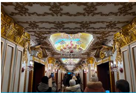
ตึกเภสัชกรรมฮาร์บิน

จากนั้นนำท่านเที่ยวชม ถนนจางยงลู่ 中央大街 ถนนสายหลักของเมืองฮาร์บิน ถนนที่เต็มไปด้วยอาคารบ้านเรือนที่เป็นสถาปัตยกรรมตะวันตกที่สร้างในช่วงคริสต์ศตวรรษที่ 18 – 19 ที่เมืองนี้ถูกปกครองโดยรัสเซีย อีกทั้งเป็นถนนคนเดินที่เป็นแหล่งรวมร้านค้าสินค้าแบรนด์เนมทั้งในและต่างประเทศ ร้านจำหน่ายของที่ระลึกและสินค้าพื้นเมือง ร้านอาหารพื้นเมืองต่าง ๆ มากมาย ให้ท่านมีเวลาอิสระเดินเที่ยวและช้อปปิ้ง หรือลิ้มรสอาหารพื้นเมืองตามอัธยาศัย.. **ให้ท่านลิ้มรสไอศกรีมชื่อดังเก่าแก่ของเมืองฮาร์บินท่านละ 1 ท่านฟรี