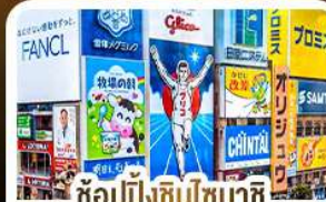
ช้อปปิ้งชินไซบาชิ และโดตงโบริ