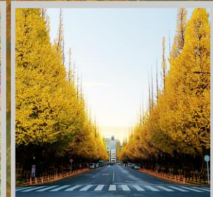
"ICHONAMIKI GINGO AVENUE"