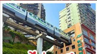
รถไฟทะลุคด