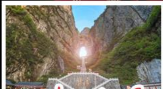
เขาประตูลั่วจื่อ