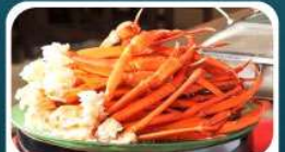
ชาบูบุฟเฟ่ต์