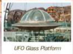
UFO Glass Platform