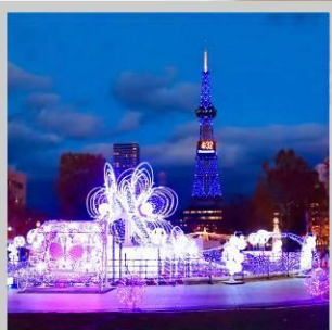
“SAPPORO WHITE ILLUMINATION”