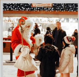
“ODORI GERMAN MARKET”