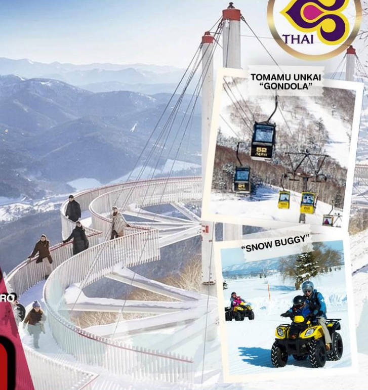
TOMAMU UNKAI "GONDOLA"