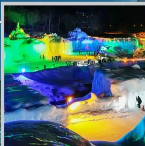
“SOUNKYO ICE FEST”