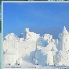
“ASAHIKAWA SNOW FEST”