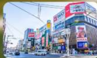
ซูซุกิโนะ