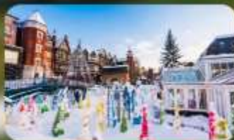
โรงงานช็อกโกแลต ชิโรอิ โคอิบิโตะ