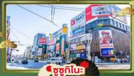
ซูซุกิโนะ