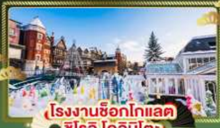
โรงงานช็อกโกแลต ชิโรอิ โคอิบิตะ